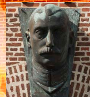
Kong Christian 10.

“Det ligner jo et tyrehoved af den slags, man finder over døren til slagterbutikker!